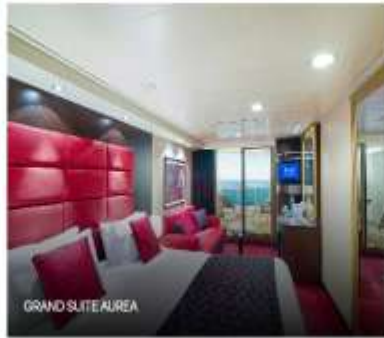
GRAND SUITE AIREA