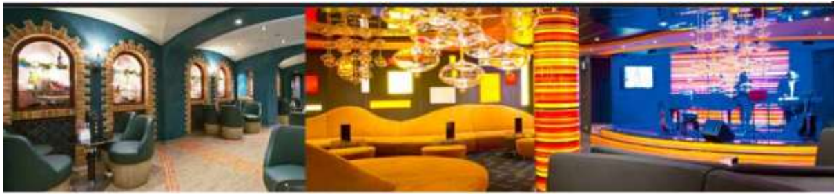
LA CANTINA DI BACCO