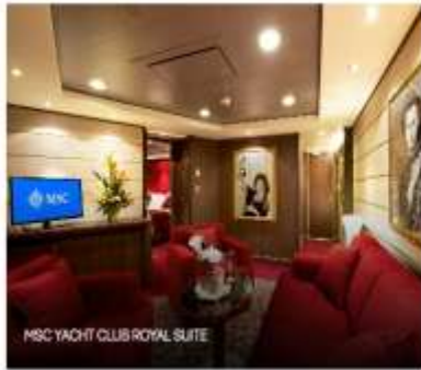
MSC YACHT CLUB ROYAL SUITE