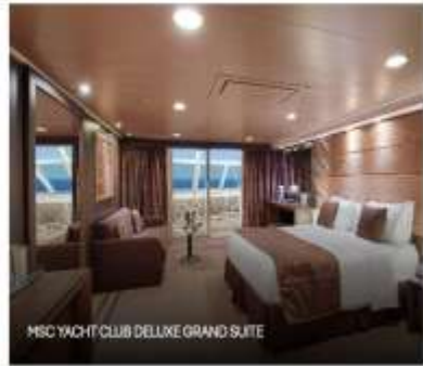
MSC YACHT CLUB DELUXE GRAND SUITE