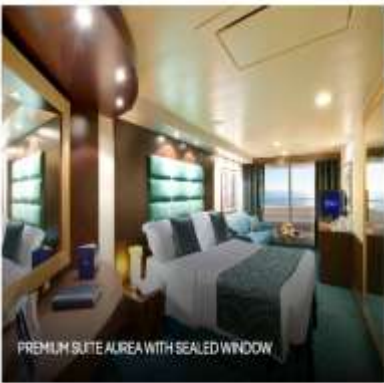
PREMIUM SUITE AIREA WITH SEALED WINDOW