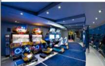
VIDEO GAMES ARCADE