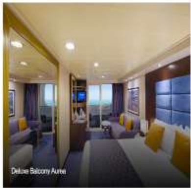
Deluxe Balcony Airea