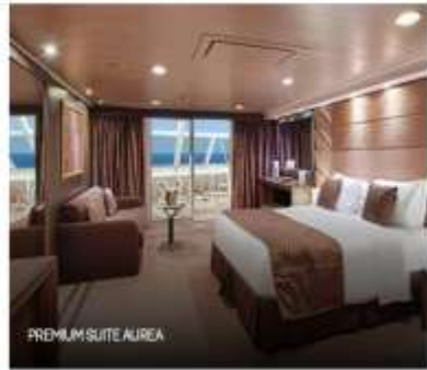
PREMIUM SUITE AIREA