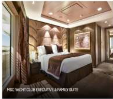
MSC YACHT CLUB EXECUTIVE & FAMILY SUITE