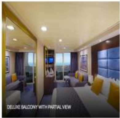
DELUXE BALCONY WITH PARTIAL VIEW