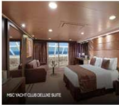
MSC YACHT CLUB DELUXE SUITE