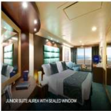
JUNIOR SUITE AIREA WITH SEALED WINDOW