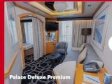
Palace Deluxe Premium