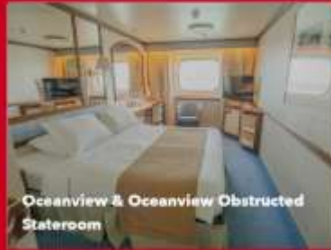
Oceanview & Oceanview Obstructed Stateroom