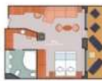
Floor Diagram Grand Suite Sleeps up to 4 10 Cabins Cabin: 498 sqft (46 m 2 ) * Size may vary, see details below.