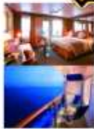
ชั้น 7 ด้านท้ายและท้ายเรือ