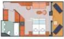
Floor Diagram Suite Sleeps up to 3 42 Cabins Cabin: 337 sqft (32 m 2 ) * Size may vary, see details below.