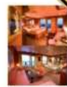
ชั้น 7 กลางเรือ