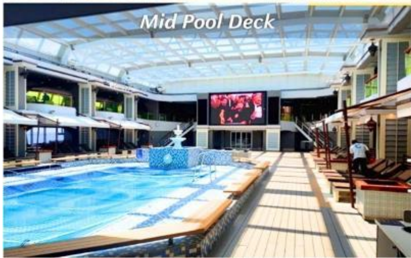
Mid Pool Deck