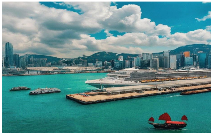
Spectrum Of The Sesa – QQCRHKG-RCI032 – (HONG KONG 5D4N) – (CRUISE ONLY)

เพื่อทำการเช็คอินก่อนอย่างน้อย 3 ชั่วโมงก่อนเรือออก จาก สนามบินนานาชาติ เซ็กลัปก๊อก เดินทางโดย Taxi มาถึง ท่าเรือใดต่ักใช้เวลาประมาณ 1ชม