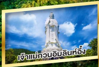
เจ้าแม่กวนอิมสินห์อึ้ง