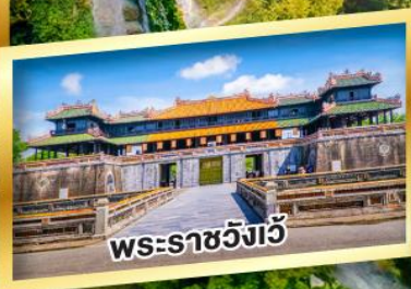
พระราชวังเว้