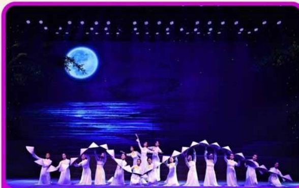
ชมการแสดง Charming Show Danang