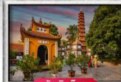
วัดเอนกวิวก