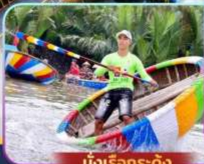
นั่งเรือกระดิ่ง