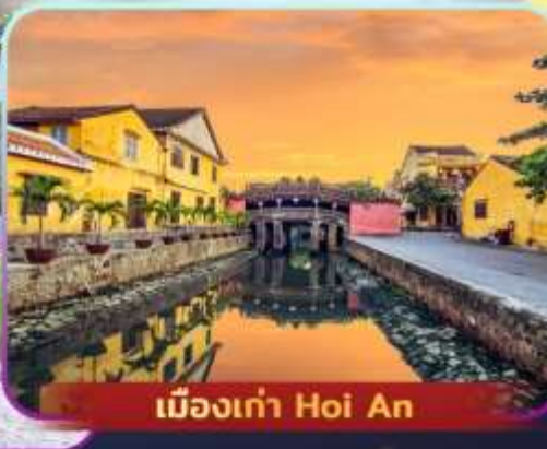
เมืองเก่า Hoi An