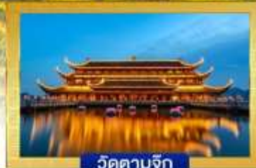
วัดตามจุก