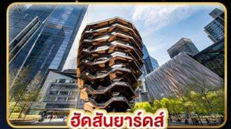
เอดส์นิยาร์ดส์

☑️ น้ำหนักกระเป๋า 46Kg. *ใบละ 23 Kg. 2 ใบ