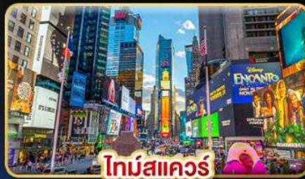
ไทม์สแควร์