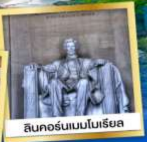
ลินคอล์นเนบโบริเยล