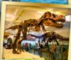
พิพิธภัณฑ์ธรรมชาติ