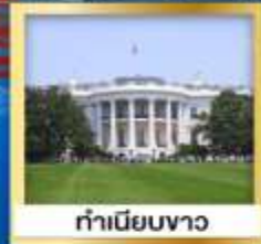
ทำเนียบขาว