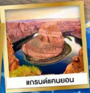
แกรนด์แคนยอน