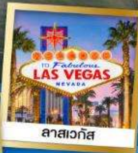
ลาสเวกัส