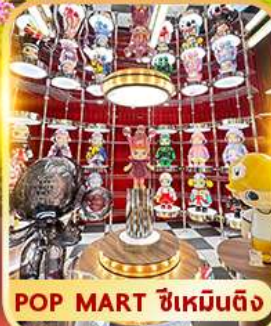
POP MART ซิเหมินตง