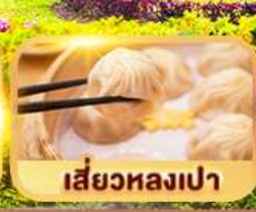
เสี่ยวหลงเปา