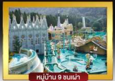
หมู่บ้าน 9 ชนเผ่า