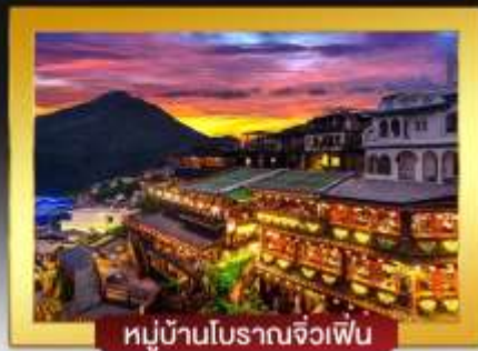
หมู่บ้านโบราณจิวเฟิน