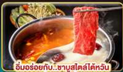
อิ่มอร่อยกับ..ชาบูสไตล์ไต้หวัน เมนูหม้อไฟจิ๋วพรีเมียม เสียวทงเป่า