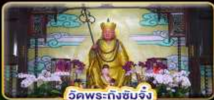
วัดพระถังซำจั๋ง

"ล่องเรือทะเลสาบสุริยันจันทรา" ขอความรักวัดหลงซาน