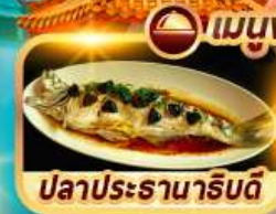
ปลาประธาราธิบดี