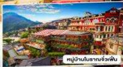
หมู่บ้านโบราณจั๋วเฟิ่น