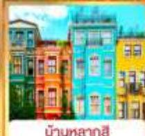
บ้านหลากสี คิสเลอร์ฟู