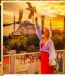
ลู่ฟือปเซเวนฮิลล์ส