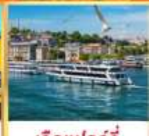
เรือเฟอร์รี่