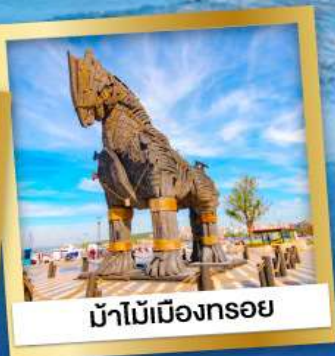
ม้าไม้เมืองทรอย