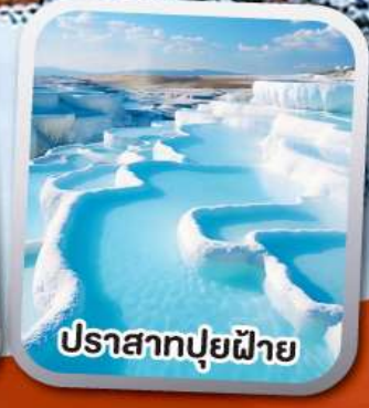
ปราสาทปุยฝาย