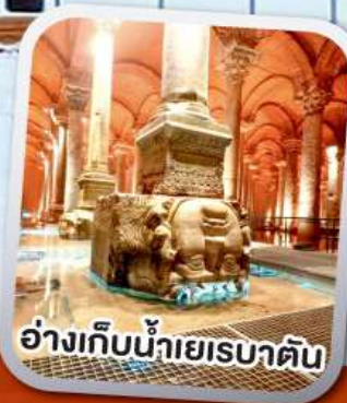
อ่างเก็บน้ำเยเรบาตัน