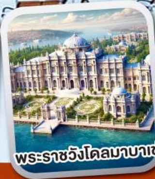
พระราชวังโดลมาบาเซ่