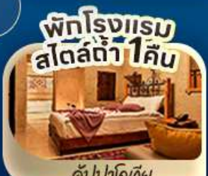
คัปปาโดเกีย

ไฮไลท์ ลิ้มผัสประสบการณ์ ดินแดนสองทวีป มรดกโลกอันทรงคุณค่า ม้าไม้เมืองทรอย สุหร้าสีน้ำเงิน ปราสาทปุยฝ้าย ทะเลสาบเกลือ หอคอยกาลาตา เทียวชม เมืองโบราณเฮียราโพลิส นครใต้ดินชาตค พระราชวังทอปกาปี อาทึยโซเฟีย สุสานอตาติร์ก