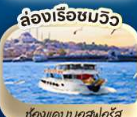
ช่องแคบบอสฟอรัส