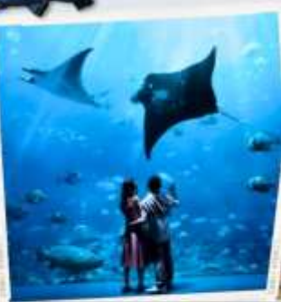
ZONE 7 : FAR FAR AWAY