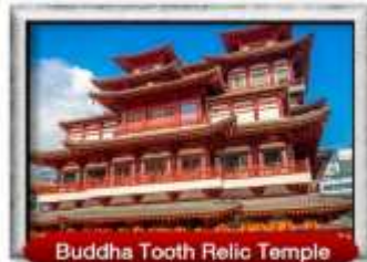
Buddha Tooth Relic Temple