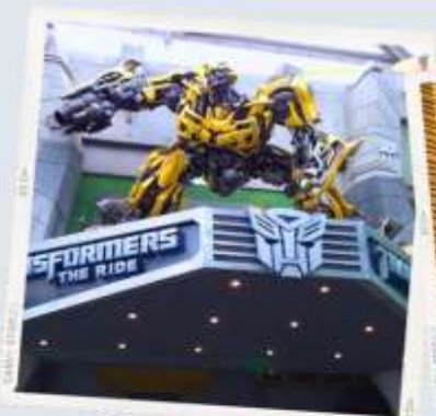
ZONE 1 : HOLLYWOOD