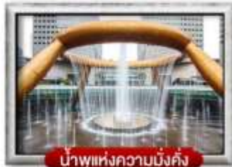
น้ำพุแห่งความมั่งคั่ง