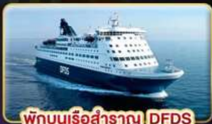
พักผ่อนเรือสำราญ DFDS