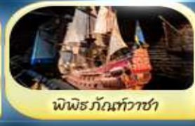
พิพิธภัณฑ์ทิวาซา