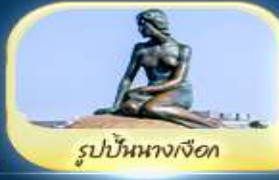
รูปปั้นนางเงือก