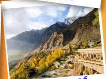
ยอดเขาดยูเกอร์