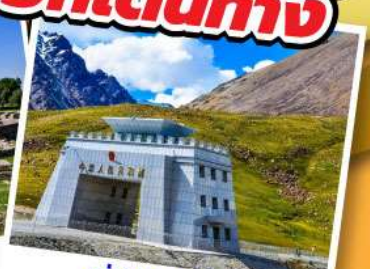
ด่านคุนจิราบ