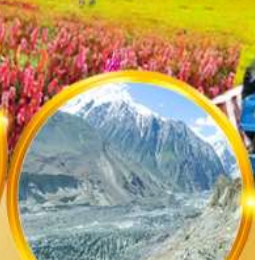
นั่งรถจี๊ป..ชมกราเซีย สัมผัสวิวสุดมหัศจรรย์