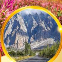
ยอดเขาสูงสุดยิ่งใหญ่แห่งพาสสุ