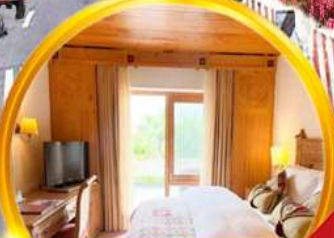
พักโรงแรมดี 4-5 ดาว มาตรฐานท้องถิ่น

1-9 พ.ค. / 1-9 มิ.ย. / 20-28 ก.ค. 10-18 ส.ค. / 14-22 กย.