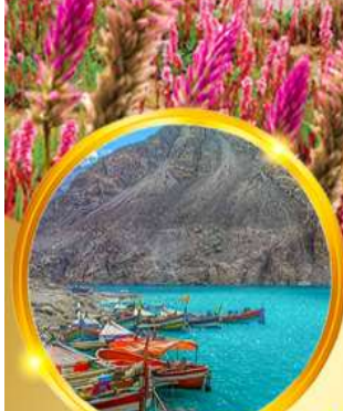
ล่องเรือชมทะเลสาบอิตตาบัต

อิสลามาบัต นาราน หุบเขาอุณน้ำ พาสสุ ด้านคุนจิราบ คิสกิต ดักติลา