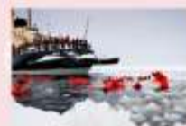
ล่องเรือตัดน้ำแข็ง Ice Breaker