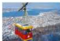
Tromso Cable Car

** ที่พัก CLARION HOTEL THE EDGE OR SIMILAR **