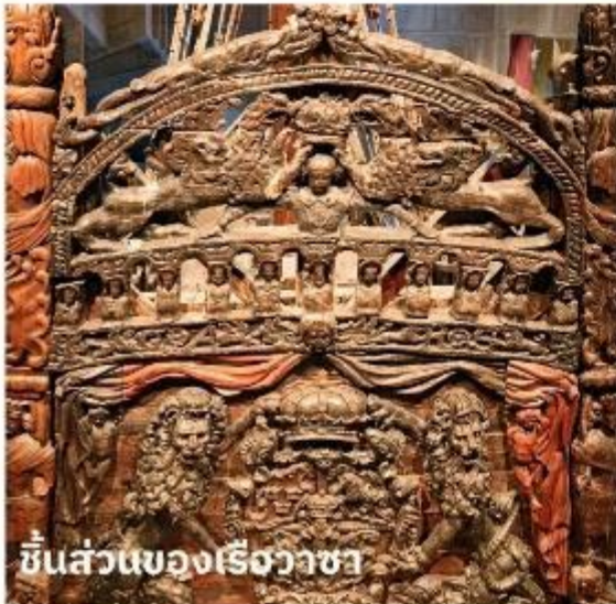
ชิ้นส่วนของเรือวาซา