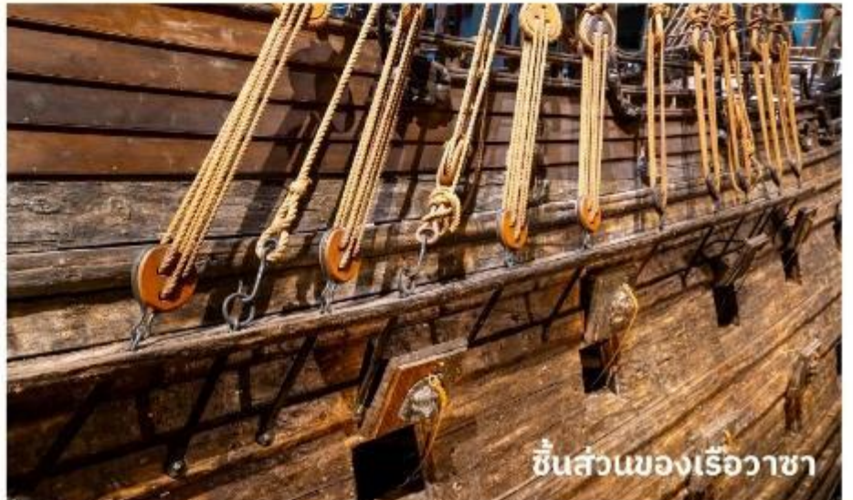
ชิ้นส่วนของเรือวาซา