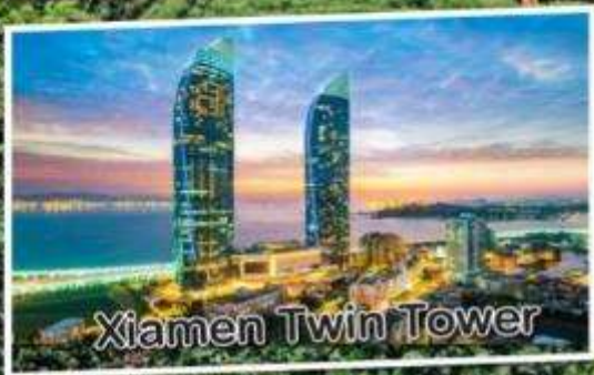
Xiamen Twin Tower