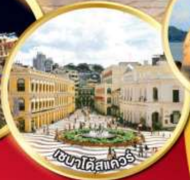
เซนาดีสแควร์