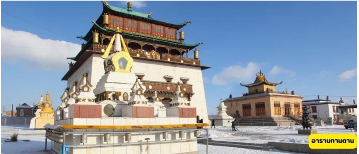
อารามกานดาน