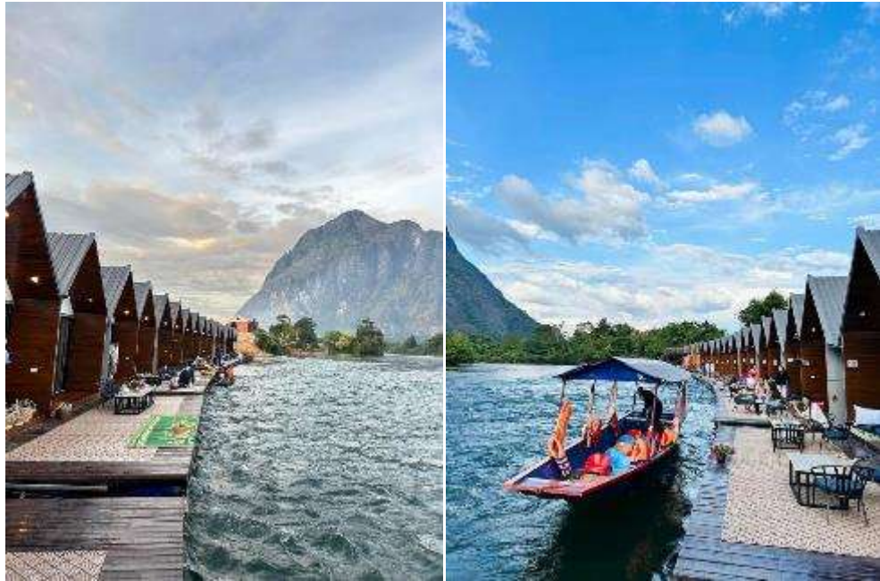
พักที่ แพรียวเวอรี่ไซด์ 2 หรือเทียบเท่า