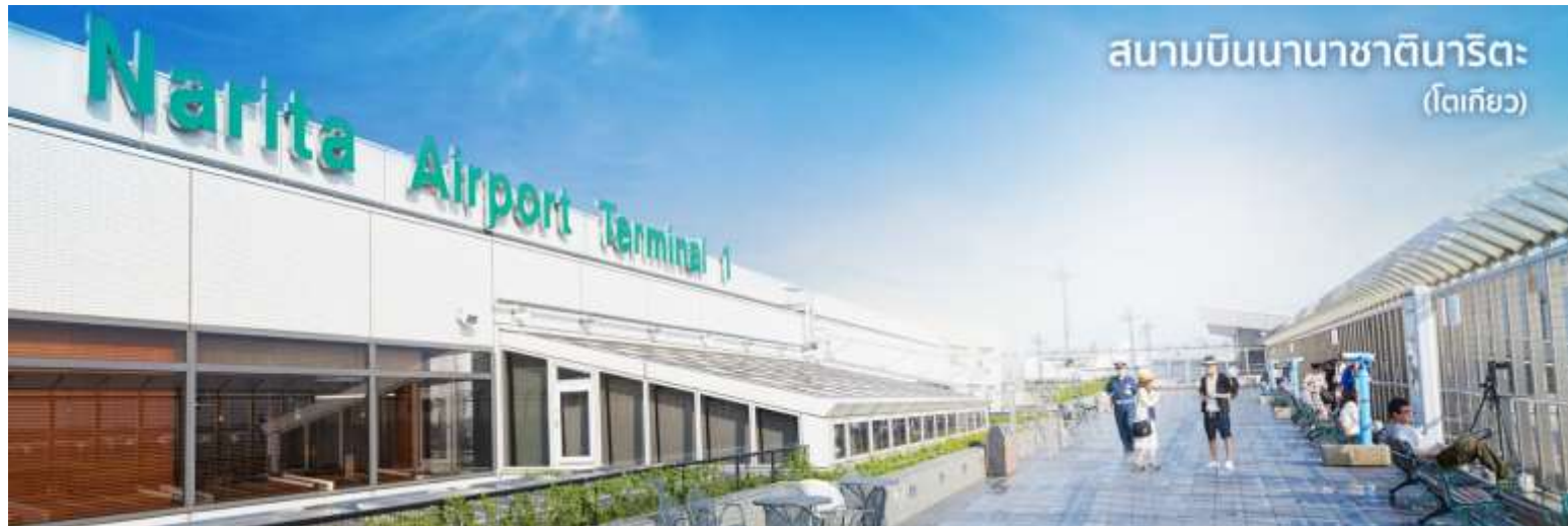
สนามบินนานาชาตินาริตะ (โตเกียว)

10.55 น. เดินทางถึง ท่าอากาศยานนานาชาตินาริตะ ประเทศญี่ปุ่น (เวลาที่ประเทศญี่ปุ่นจะเร็วกว่าประเทศไทย 2 ชม.ควรปรับนาฬิกาของท่านเพื่อสะดวกในการนัดหมาย) นำท่านผ่านขั้นตอนการตรวจคนเข้าเมืองและศุลกากร พร้อม ตรวจเช็คสัมภาระ เรียบร้อยแล้ว สำคัญมาก!! ประเทศญี่ปุ่นไม่อนุญาตให้นำอาหารสด เนื้อสัตว์ พืช ผัก ผลไม้ เข้าประเทศ หากฝ่าฝืนมีโทษปรับและจับ