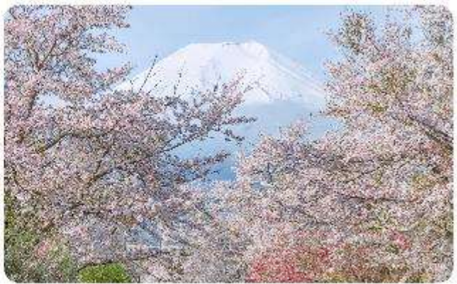
หมู่บ้านน้ำใสโอชิโนะ อักโก

โอชิโนะ อักโก หรือ ที่รู้จักกันในชื่อ หมู่บ้านน้ำใส ความงามแห่งธรรมชาติและวัฒนธรรมที่ ซ่อนอยู่ใต้ภูเขาไฟฟูจิโอชิโนะ อักโก ตั้งอยู่ในหมู่บ้านโอชิโนะ จังหวัดยามานาชิ ประเทศญี่ปุ่น เป็นแหล่งน้ำธรรมชาติที่มีชื่อเสียง ประกอบด้วยบ่อน้ำใสสะอาดทั้งแปดแห่ง ซึ่งน้ำในบ่อเหล่านี้เกิด จากการละลายของหิมะและน้ำแข็งจากภูเขาไฟฟูจิ น้ำที่ไหลลงมานั้นได้ถูกกรองผ่านชั้นหินภูเขาไฟ เป็นเวลาหลายปี จนทำให้น้ำในบ่อมีความบริสุทธิ์และใสจนเห็นถึงก้นบ่อ ไม่เพียงแต่ความงามของ