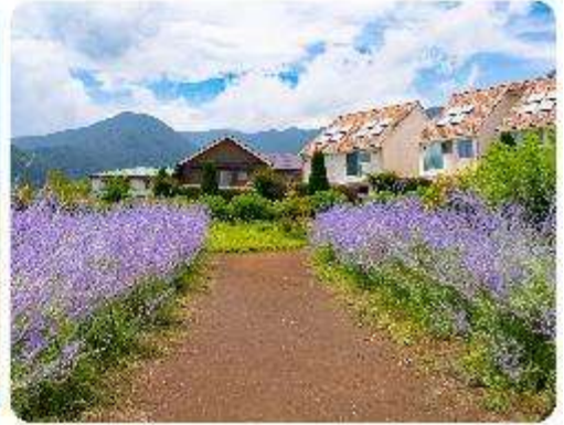
สวนโออิชิ ปาร์ค

สวนดอกไม้โออิชิ พาร์ค (Oishi Park) มหัตศรรย์แห่งวิวกุเขาไฟฟูจิ หนึ่งในจุดชมวิวกองกุเขาไฟฟูจิที่สวยงามที่สุดอีกจุดหนึ่ง ที่จะเติมเต็มความสงบและความงดงามของธรรมชาติในญี่ปุ่นเมื่อไปเยือน คือสถานที่ที่ไม่ควรพลาด สวนดอกไม้โออิชิ พาร์ค (Oishi Park) แห่งนี้ไม่ได้เป็นเพียงสถานที่ที่มีดอกไม้สวยงามให้เราได้ชื่นชมแล้ว จุดเด่นของสวนนี้คือวิวกุเขาฟูจิที่อยู่เบื้องหลังสวนดอกไม้สีแสนสดใส ที่บานสะพรั่งในทุกฤดูกาล และยังเป็นมุมที่ให้เราได้สัมผัสกับวิวกุเขาฟูจิได้อย่างใกล้ชิด จากนั้นนำพาทุกท่านสู่..