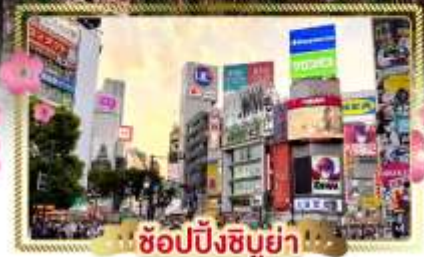
ช้อปปิ้งชิบูย่า