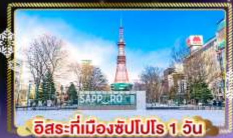
อิสระที่เมืองซัปโปโร 1 วัน