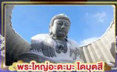
พระใหญ่อะตะมะโดบุตสึ