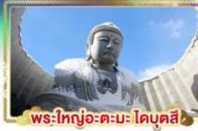
พระใหญ่อะตะมะโคบุตสึ