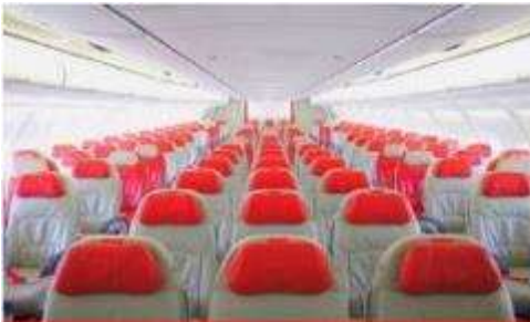
เครื่องลำใหญ่ 377 ที่นั่ง