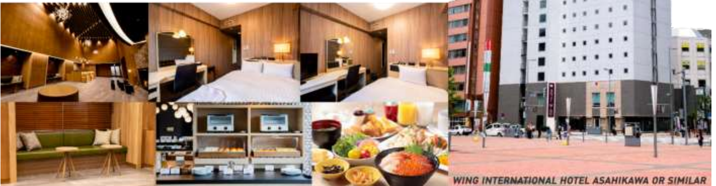
WING INTERNATIONAL HOTEL ASAHIKAWA OR SIMILAR

ที่พัก WING INTERNATIONAL HOTEL หรือ ART ASAHIKAWA, หรือเทียบเท่า