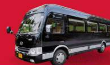
BUS (10-18 ท่าน)