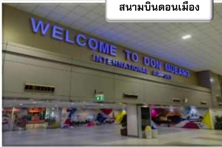
สนามบินดอนเมือง

เวลา 23.30 น. พร้อมกันที่ สนามบินดอนเมือง อาคารผู้โดยสารขาออกระหว่างประเทศเคาน์เตอร์ สายการบินไทยแอร์เอเชีย เอ็กซ์ เจ้าหน้าที่คอยให้การต้อนรับ ดูแลด้านเอกสาร เช็คอิน และสัมภาระในการเดินทาง