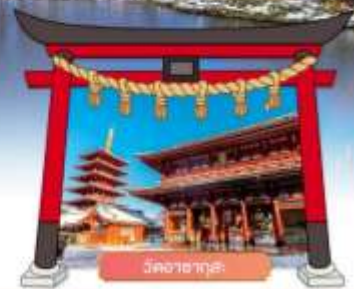
วัดอาซากุสะ

เดินทางโดยสารการบิน : ไทยแอร์เอเชียเอ็กซ์