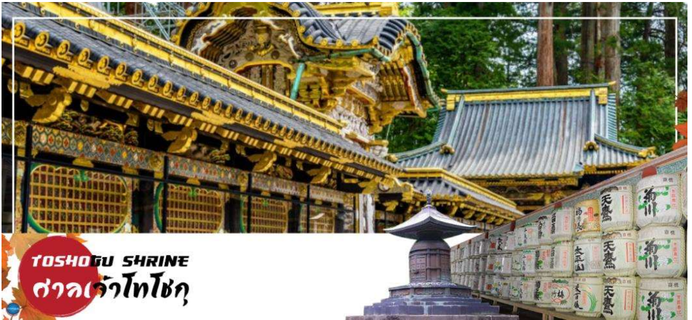
TOSHOGU SHRINE ศาลเจ้าโทโชกุ

เมืองนิกโกะ – ผ่านชม สะพานชินเคียว – ศาลเจ้าโทโชกุ – ศาลเจ้าฟูตาระ – จังหวัดไซตามะ – ย่านเมืองเก่าคาวะโกเอะ – ตระกูลกวางด – เมืองยามานาชิ – ออนเซ็น + ชาบูยักษ์