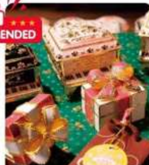
กล่องดนตรี MUSIC BOX