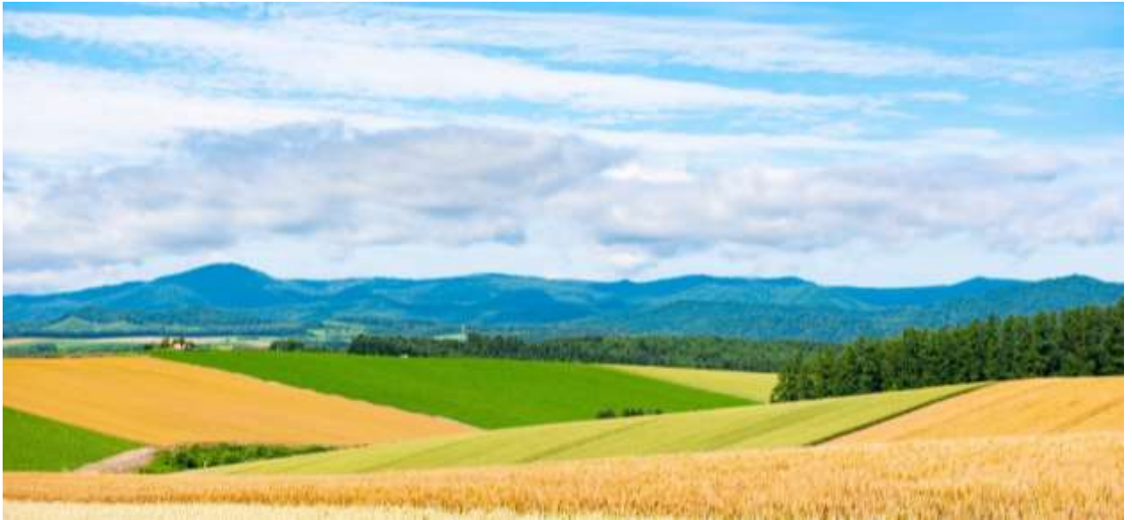
ความงดงามจากธรรมชาติ

ถ่ายรูปเช็คอินที่เป็นพระพุทธรูปเจ้า (Hill of The Buddha) (ค่าทัวร์รวมค่าเข้าไหว้องค์พระ) ผลงานชิ้นเอกของทาดาโอะ อันโดะ (Tadao Ando) สถาปนิกชาวญี่ปุ่นเจ้าของรางวัลพีริซเกออร์ที่ถือว่าที่สุดรางวัลของสถาปนิก โดยมีลักษณะเป็นเนินเขาล้อมรอบรูปปั้นพระพุทธรูปสีขาว ผสมผสานที่ลงตัวระหว่างสถาปัตยกรรมที่มนุษย์สร้างขึ้นกับ