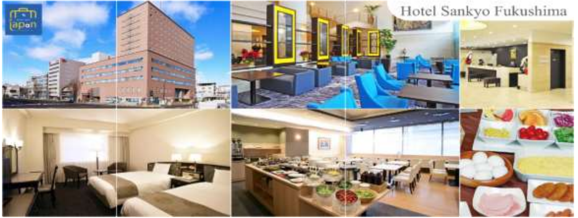
Hotel Sankyo Fukushima

วันที่สาม เมืองฟุกุชิมะ – ซาโอะ – ภูเขาไฟซาโอะ (นั่งกระเช้า) – เมืองยามากาตะ – กินชัง ออนเซ็น – เมืองเซนได – ถนนคิลิโรรัด