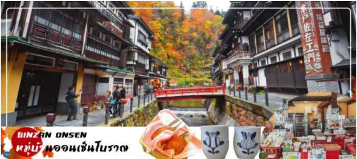
GINZAN ONSEN หมู่บ้านออนเซ็นโบราณ

เช้า รับประทานอาหารเช้า ณ ห้องอาหารของโรงแรม (2) นำท่านชมความงามแปลกตาของฤดูใบไม้เปลี่ยนสี ณ ภูเขาไฟซาโอะ (ZAO VOLCANO) (ใช้เวลาเดินทางประมาณ 1.30 ชั่วโมง) จุดชมใบไม้เปลี่ยนสีที่มีชื่อเสียงของภูมิภาคโทโฮคุ ตลอดเส้นทางท่านจะได้เพลิดเพลินกับธรรมชาติหลากหลายสีสันของป่าเขาในฤดูใบไม้ร่วง จากนั้นนำท่าน ขึ้นกระเช้าไฟฟ้า สูดอากาศให้ท่านได้ชมทัศนียภาพอันสวยงามของฤดูใบไม้เปลี่ยนสีไปยังยอดเขาที่ระดับความสูง 1,736 เมตร ด้านบนประดิษฐานพระพุทธรูปจิโสะองค์ใหญ่ แกะสลักจากหินคาคดผ้าเอี่ยมสีแดงไว้ที่หน้าอกเพื่อเป็นการอุทิศให้กับทหารที่เสียชีวิตจากการทำแท้ง นอกจากนี้ยังมีทะเลสาบบริเวณปากปล่องภูเขาไฟซาโอะคือ ทะเลสาบโอกามะ หรือทะเลสาบห้าสี ซึ่งสีของน้ำจะเปลี่ยนไป