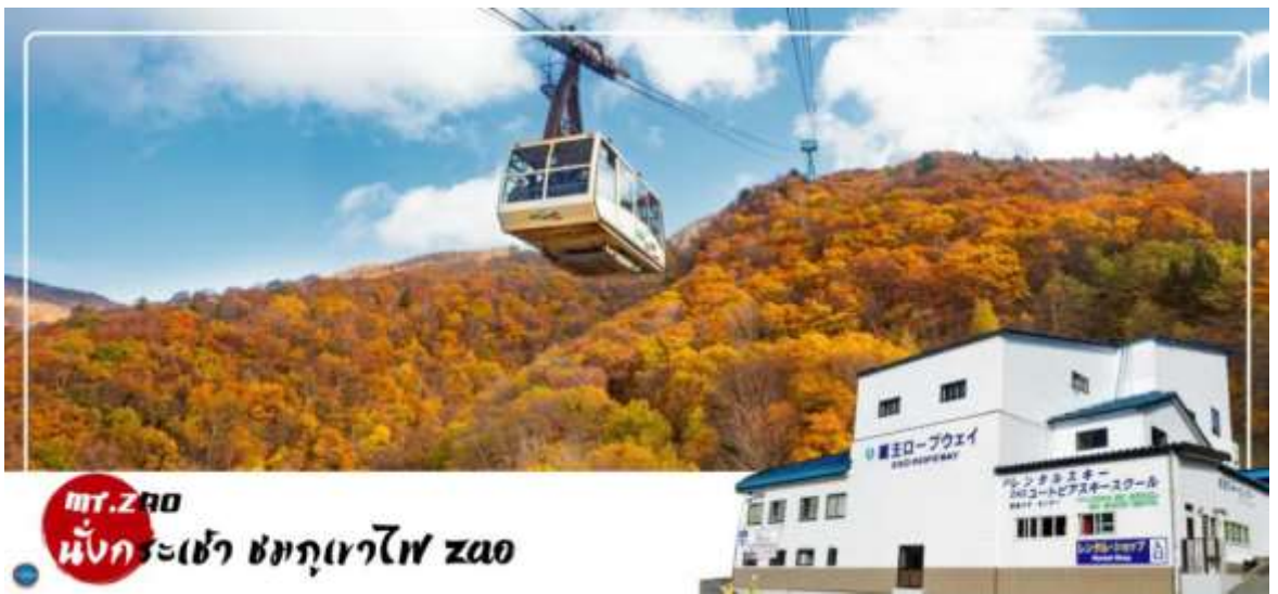
mt. ZAO นั่งกระเช้า ชมภูเขาไฟ zao

วันที่สาม เมืองฟุกุชิมะ – ซาโอะ – ภูเขาไฟซาโอะ (นั่งกระเช้า) – เมืองยามากาตะ – กินชัง ออนเซ็น – เมืองเซนได – ถนนคิลิโรรัด