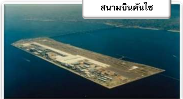
สนามบินคันไซ