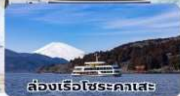
ล่องเรือโฮระคาเสะ