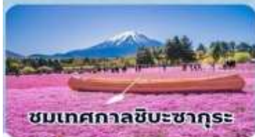
ชมเทศกาลชิบะซากุระ