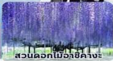
สวนดอกไม้เอจิคาเงะ